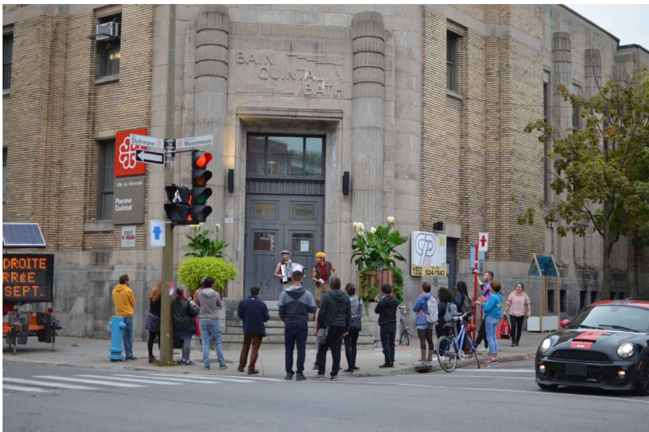
Les artistes du Cirque Hors Piste. Un des arrêts du parcours devant le Bain Quintal.