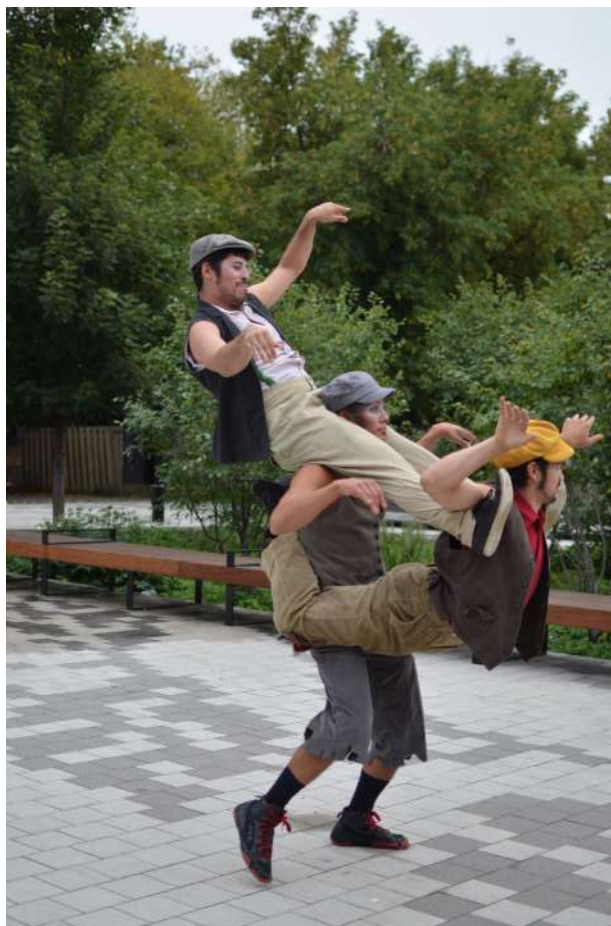
< Les artistes du Cirque Hors Piste. Un des arrêts du parcours devant le Centre Gédéon-Ouimet.