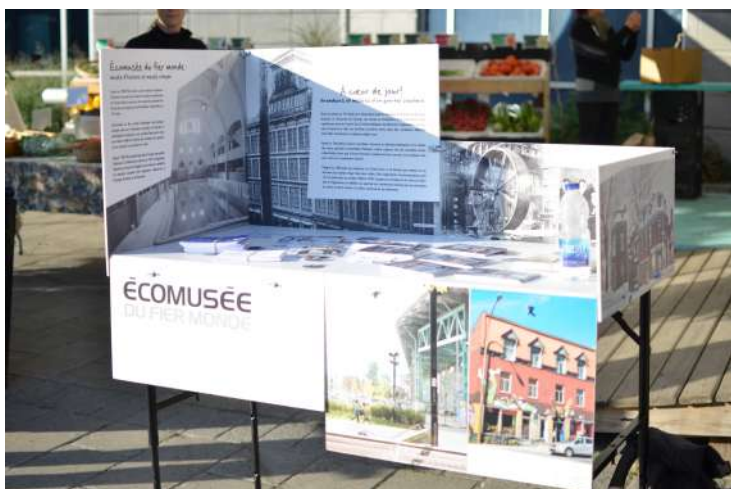
Ci-dessus: Kiosque de l'Écomusée au départ des parcours, sur la place Frontenac

De plus, tout au long du circuit, le public est amené à rencontrer les différents mobiliers de l'installation Résonance , créée par Conscience Urbaine, et à observer les photos et les récits qu'ils contiennent. Ainsi, le circuit permet au public d'en apprendre davantage sur le patrimoine et l'histoire du quartier. En clôture des parcours, des surprises artistiques différentes chaque jour sont présentées sur la Friche au Pied-du-Courant.