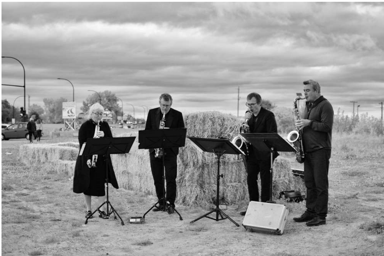
Le quatuor Quasar finit son parcours à la Friche au Pied-du-Courant cc Lucie Desaubies