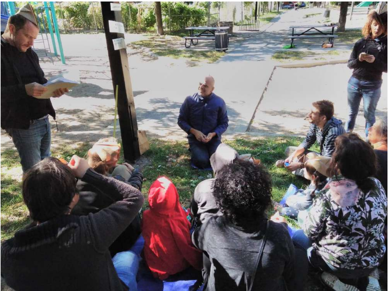
Les artistes de la République des Rêves au Parc Sainte-Marie