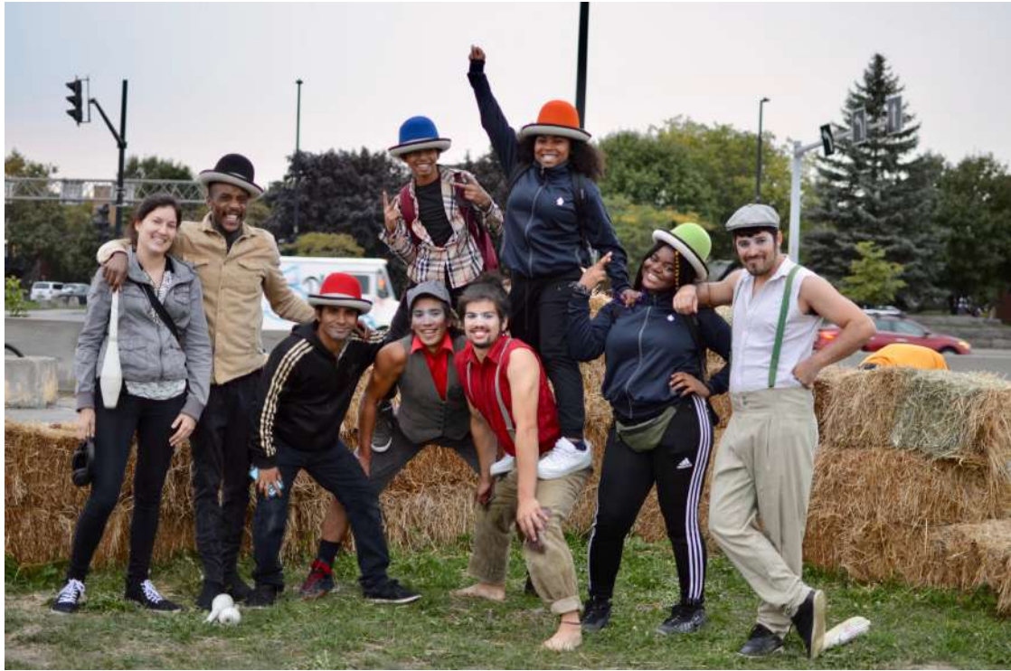
Le groupe de jeunes de la Maison des Jeunes L'Escampette et les artistes du Cirque Hors Piste.